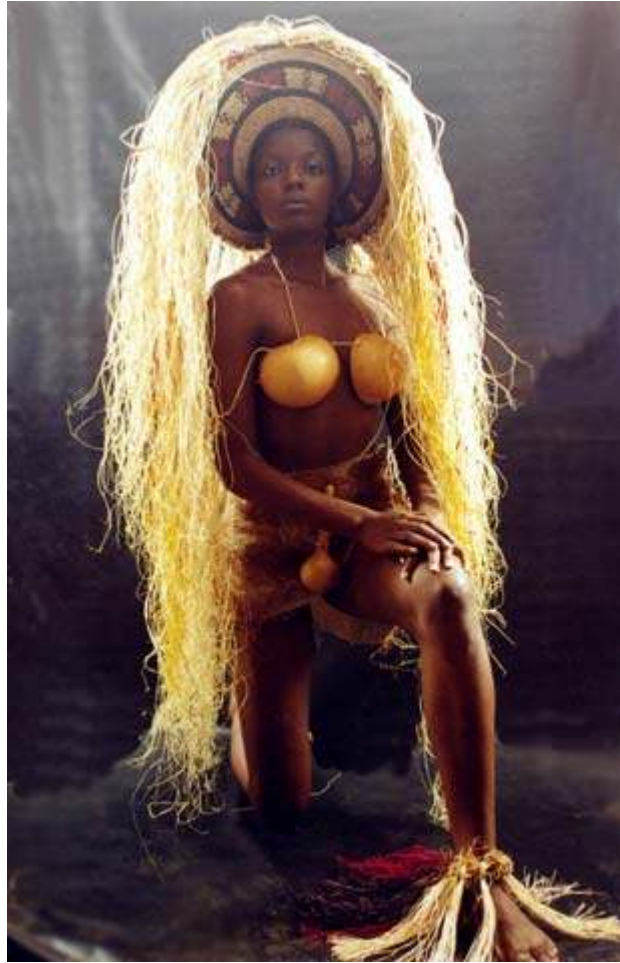
Création Anggy Haïf